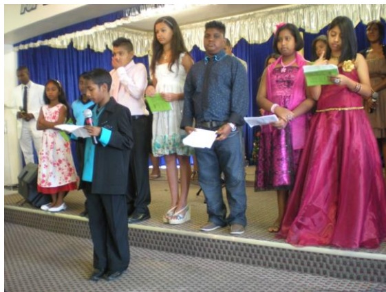
Crianças no culto de natal