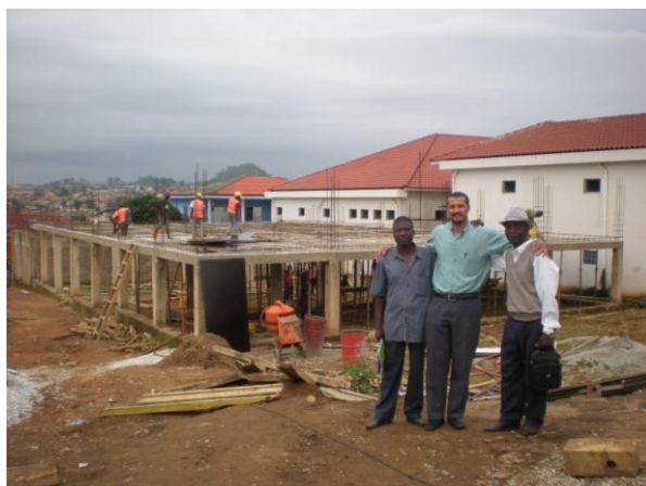
Construção do temple da IB. Centro Uíge Angola