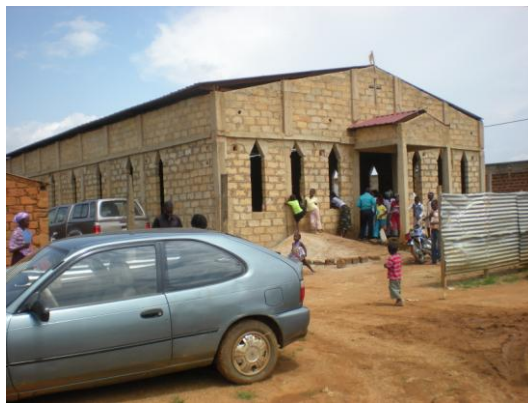
Templo I B Papelão Uíge Angola

V iagem a Angola. Fiz uma viagem a Angola entre os dia 17 de novembro a 6 de Dezembro com objetivo de conseguir as documentações que minhas filhas precisavam para se matricularem na escola aqui e também aproveitando para dar aulas no ITBU e ter um trabalho específico com os pastores e líderes de lá. Com relação a documentação das meninas, foi uma grande, tomando quase o tempo todo agendado para lá, mas em Luanda, e me fazendo gastar em torno de 900 dólares em taxas, mas consegui graças a Deus. Por outro lado fiquei muito contente ao ver o desenvolvimento do trabalho em Uíge; o Instituto continua firme fazendo seu trabalho apesar da grande necessidade que a biblioteca em termos de material esta fazendo para eles.