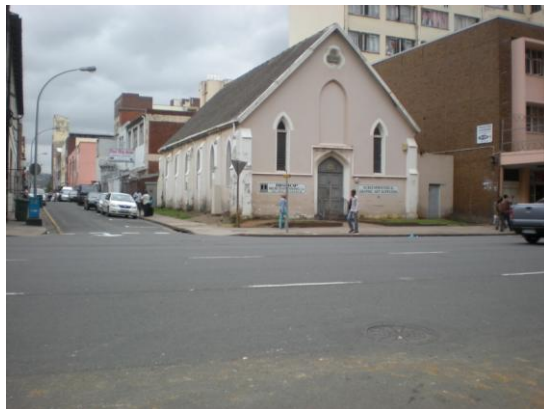
Ex templo batista, funciona como comércio

Grandes desafios. Fizemos cultos, oramos pelas pessoas fomos pelas ruas evangelizando taxistas e etc..., enfim grandes desafios para evangelização urbana da cidade de Durban. Por outro lado vimos um grande contraste que até o momento ainda estou tentando entender; em pleno centro urbano, num lugar complicado,