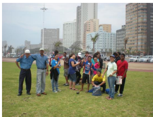
Parte da equipe que estava evangelizando na cidade de Durban

E vangelização. Desenvolvemos um projeto no final do no passado com a União Batista, com quem cooperamos na África do Sul, onde eles trouxeram uma equipe de jovens de Johannesburg e juntos trabalhamos na evangelização em vários lugares da cidade de Durban e ai de uma forma mais específica iniciamos a conhecer outras realidades do contexto da cidade como: a) “Favelas verticais”, a maioria dos prédios de habitação na cidade de Durban, e não são poucos, se constituem em verdadeiras favelas e em alguns casos muito perigosas; b) Os “Shelters” em inglês, que significa abrigo em português, alguns são simplesmente deprimentes, lugares que na ideia original seria abrigar pessoas que não tem onde dormir na cidade, ou que estão de passagem, mas ali termina juntando pessoas de todo tipo como alcoólatras, drogados, prostitutas e o pior de tudo que nesse meio há pessoas que tentam ser certas, mas não têm onde ficar e vão para lá; vimos várias mães com crianças de 4 a 10 anos nestes lugares por não ter onde ficar.