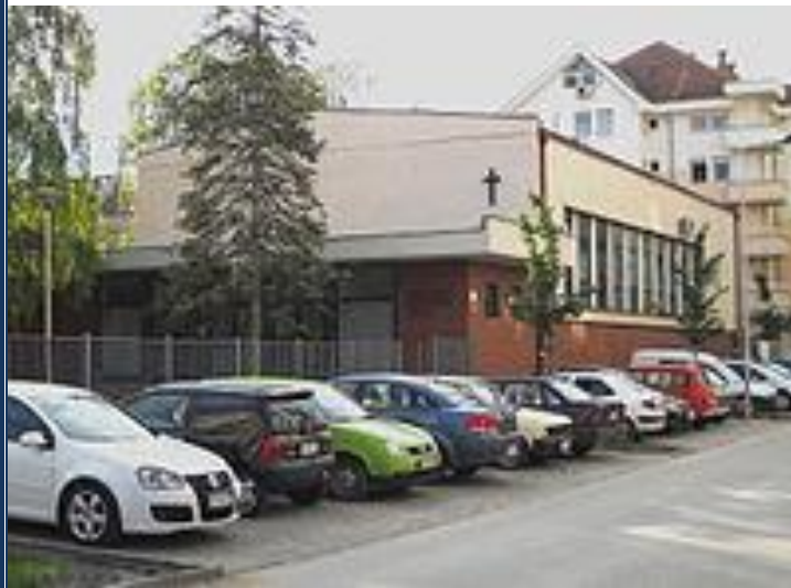
IGREJA BATISTA DE NOVA SADI-BELGRADO

Nessa última quinta-feira entraram em campo pela 22ª Copa do Mundo de Futebol da FIFA, os selecionados do Brasil e da Sérvia. O selecionado sérvio de futebol perdeu para o do Brasil por dois gols a zero.