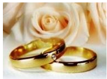
Encontro de Casais